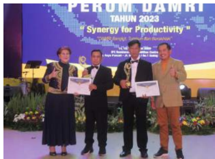
Cabang Terbaik II Tahun 2022 Cabang Denpasar