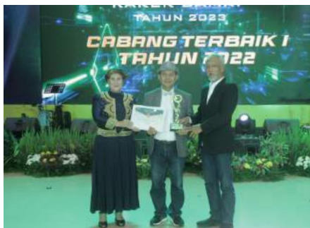
Cabang Terbaik I Tahun 2022 Cabang Bandar Lampung