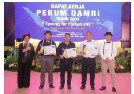
Peringkat I Zero Accident Tahun 2022 Cabang Medan